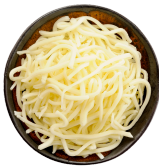
Queso grana padano Nuria 3088