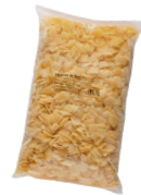
Provolone dolce porcionado Ken 3096